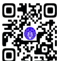
慶念寺ホームページ QR コード