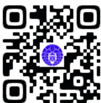
慶念寺ホームページ QR コード